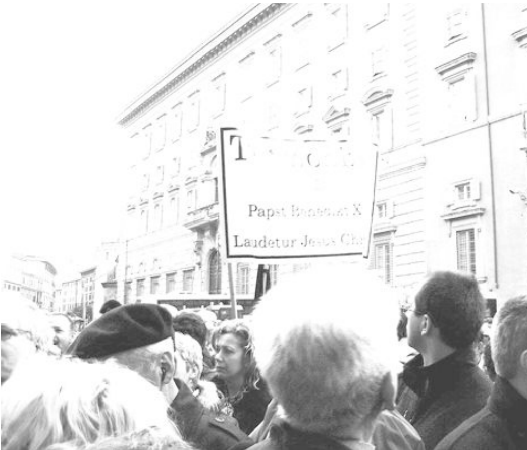
„Tittmoning grüßt Papst Benedikt XVI. – Laudetur Jesus Christus (Lobet Jesus Christus)“ stand auf einem großen Transparent, das die Tittmoninger mit in den Vatikan brachten.