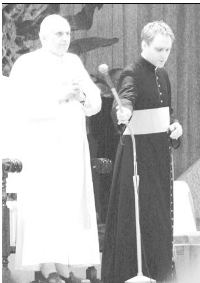
Papst Benedikt XVI., daneben sein Privatsekretär Monsignore Georg Gänswein, spendete bei der Generalaudienz am Mittwochvormittag den Tittmoningern den apostolischen Segen.