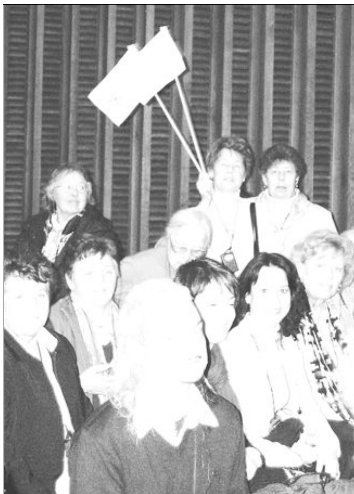
Die Tittmoninger hatten zur Generalaudienz kleine Fähnchen mitgebracht und freuten sich auf die Begegnung mit dem Heiligen Vater.