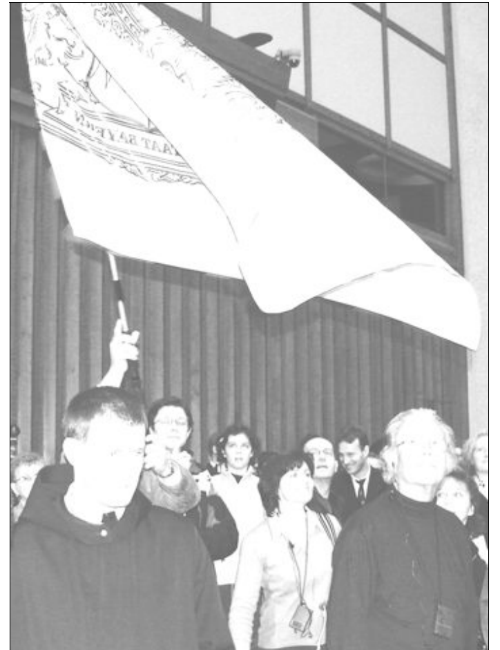
Die bayerische Fahne durfte bei der Generalaudienz natürlich nicht fehlen!